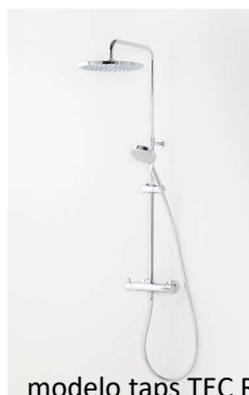
modelo taps TEC ROUND