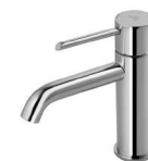
modelo taps ROUND