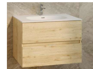
modelo SMART de 1 Y 2 cajones + lavabo KRION